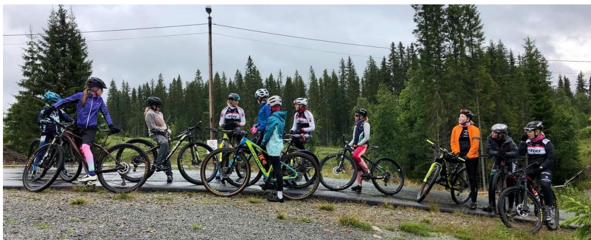
Jentedag med de yngre jentene i Brumunddal i regi av Frøy elite jr. og sr.

I sommerferien fikk vi jentene gleden av å arrangere en jentedag i Brumunddal hvor vi inviterte jenter fra de yngre klassene til en felles-trening med teknikkøkt og hardøkt for å forberede oss til NM. Utrolig gøy for oss å kunne bidra til å skape et bedre jente-miljø, noe vi alle brenner litt ekstra for. Veldig imponerende å se hvor høyt nivå det er på de yngre jentene! Dette håper vi å få til mer av i 2021.