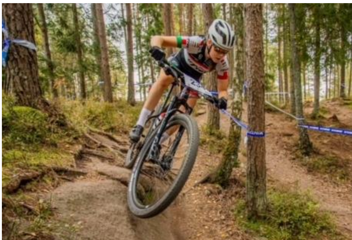
Oda på vei mot NM-seier

Vinnerne våre ble da samtidig regionsmestere !!!