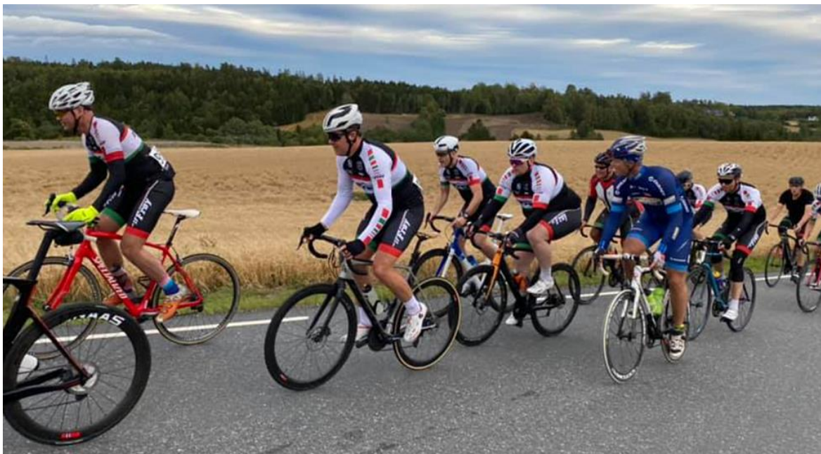
Klubbmesterskapet i fellesstart gikk i en ny trase i Ås. Den ble godt likt av deltakerne.