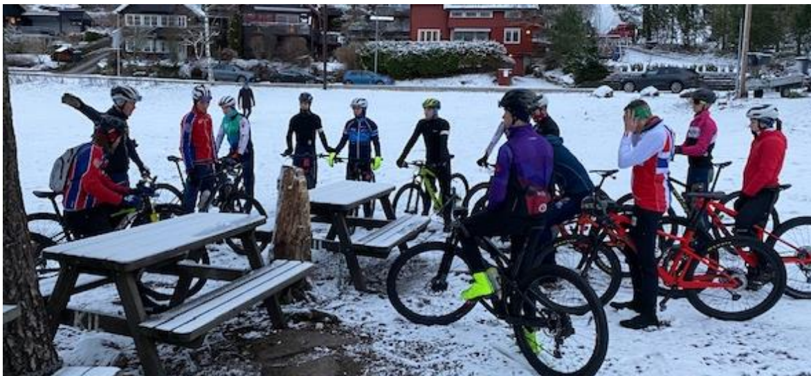
Fra fellestrening Langsetløkka 12. desember